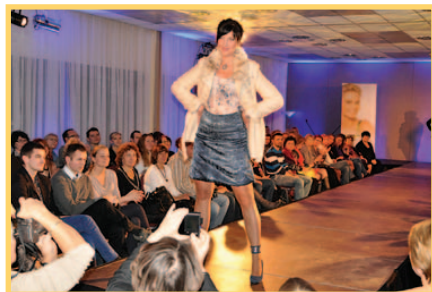
Pokaz mody