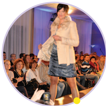
Pokaz mody

Cieszę się małymi rzeczami, bo one są najważniejsze. Sztuką jest czerpanie radości ze zwykłych, małych rzeczy. Ja już się tego nauczyłam. Nauczyłam się też dbać o siebie, dbać o swoje zdrowie. W chwili obecnej mam dobre wyniki badań kontrolnych. Badaniom poddaję się regularnie, bo to jest konieczne. Trzeba mieć przewagę nad chorobą, wychwycić niepokojące sygnały od razu, badać się u specjalistów.