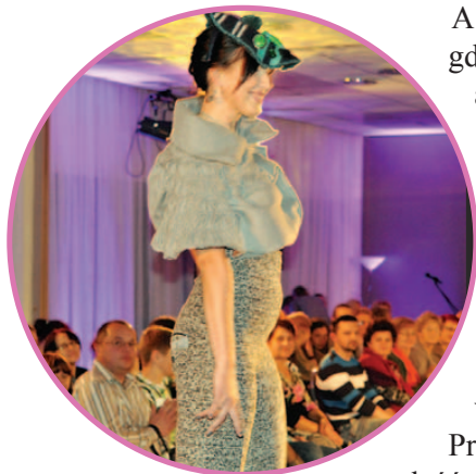
Pokaz mody, fot. archiwum Stowarzyszenia „Różowe Okulary”

A teraz tym bardziej chcę tak żyć. Nigdy nie brakowało mi optymizmu, a kontakt z osobami ze Stowarzyszenia i uczestnictwo w warsztatach psychoonkologicznych metodą simon-tonowską utwierdził mnie w przekonaniu, że trzeba obudzić w sobie tzw. zdrowy egoizm i zrobić w końcu coś dla siebie.