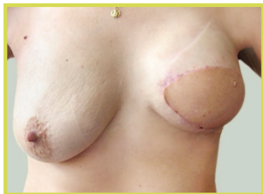
Rekonstrukcja piersi lewej płatem z mięśnia najszerzego grzbietu i protezą piersiową. Widoczna asymetria piersi prawej, która będzie wymagała zabiegów korekcyjnych