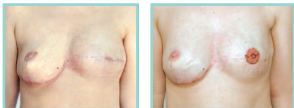
Podskórna amputacja z jednoczasową rekonstrukcją piersi po stronie prawej z wykorzystaniem protezy piersiowej. Po stronie lewej rekonstrukcja piersi ekspanderoprotezą. Rekonstrukcję zakończyło odtworzenie kompleksu otoczka-brodawka. Kobieta po amputacji piersi lewej. Nosicielka mutacji genowej BRCA1

Metoda rozprężania tkanek jest często wybierana przez chirurgów i pacjentki, głównie dzięki swojej prostocie i krótkiemu okresowi rehabilitacji. Metodę tą powinno stosować się w przypadkach rekonstrukcji jednoczasowych, kiedy odtworzenie piersi protezą nie jest możliwe z powodu braku odpowiedniej ilości skóry i mięśnia do jej pokrycia. Sytuacja taka powstaje w przypadkach konieczności wycięcia centralnej części piersi wraz z otoczką i brodawką lub też w przypadku dużych piersi. Do dyspozycji chirurga są ekspanderoprotezy. Są to protezy posiadające możliwość dopełniania roztworem soli fizjologicznej poprzez specjalny zaworek wszczepiany wraz z protezą. Dzięki takiej budowie istnieje możliwość uzyskania znacznie większego rozmiaru wyniosłości piersi niż zwykłą protezą piersiową, bowiem rozprężanie można wykonywać stopniowo po wygojeniu rany, przyzwyczajając skórę do coraz większego rozciągnięcia. Ekspanderoprotezy nie wymagają wymiany po dopełnieniu do żądanych wymiarów i pozostają na stałe.